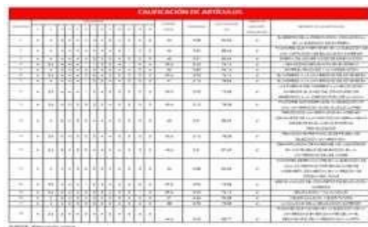
Tabla 1. Evaluación de Colín.

El objetivo de este trabajo de investigación es presentar los resultados de un estudio realizado en dos Instituciones de Educación Superior de la Ciudad de México en la Alcaldía Iztapalapa, el cual está enfocado a determinar los factores que los alumnos consideraron al tomar la decisión de formar parte de una universidad e identificar los niveles de importancia que éstos tenían para ellos.