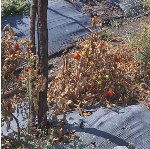
Figura 1. Producto no cosechado por no ser rentable. En la siguiente temporada de siembra se arroja a la basura. Elaboración propia (Oacalco, Morelos;2023).

Actualmente existen algunas propuestas desarrolladas por organismos y empresas buscando solucionar el problema del desperdicio de alimentos, como es el caso de los bancos de alimentos, pero pocos atienden la pérdida de los alimentos directamente en el campo, problema que afecta a múltiples zonas de nuestro país. Con la propuesta del secador solar se busca brindar a los productores agrícolas una nueva alternativa para no abandonar los productos en los campos de cultivo, fomentar su recolección o cosecha para su posterior secado y venta como productos deshidratados.