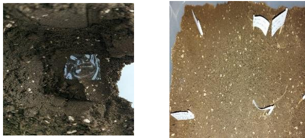
Figura 2. Preparación biodegradación de películas en el suelo

Los resultados obtenidos son similares a los mostrados en un estudio elaborado por Oberlinter y col. (2021) de películas de quitosano disuelto en ácido láctico y combinadas con un antioxidante de encino en donde las películas formadas únicamente con quitosano en un periodo de 3 días llegaron a hidratarse y deformar su estructura original al incorporarlas en 3 diferentes tipos de suelos [18].