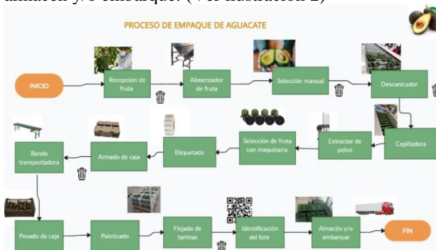
Ilustración 2. Proceso de empaque de aguacate.

Para el proceso de embarque, procesado y empaques se sigue una serie de etapas que van desde la recepción de la fruta, alimentación en máquinas, selección manual, destupado, cepillado, extracción de polvo, selección por calibres, etiquetado, armado en caja, transporte, pesado, paletizado, flejado de tarimas, identificación de lote, almacén y/o embarque. (Ver ilustración 2)